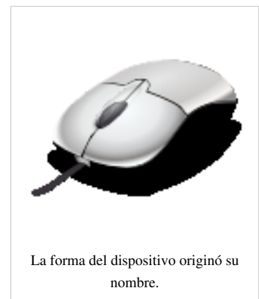
La forma del dispositivo originó su nombre.

En América predomina el término inglés mouse (plural mouses y no mice [1] ) mientras que en España se utiliza prácticamente de manera exclusiva el calco semántico «ratón». El Diccionario panhispánico de dudas recoge ambos términos, aunque considera que, como existe el calco semántico, el anglicismo es innecesario. [2] El DRAE únicamente acepta la entrada ratón para este dispositivo informático, pero indica que es un españolismo. [3]