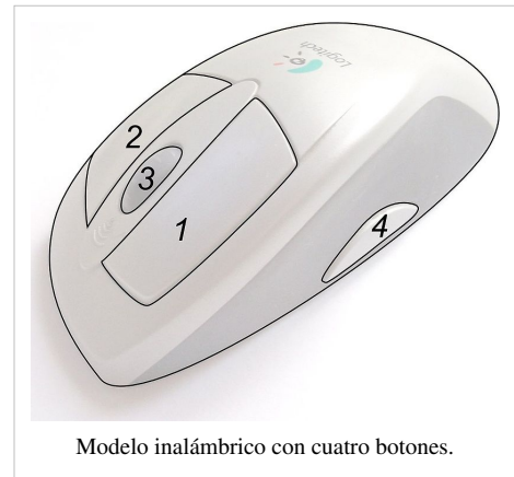
Modelo inalámbrico con cuatro botones.

La sofisticación ha llegado a extremos en algunos casos, por ejemplo el MX610 de Logitech, lanzado en septiembre de 2005. Preparado anatómicamente para diestros, dispone de hasta 10 botones.