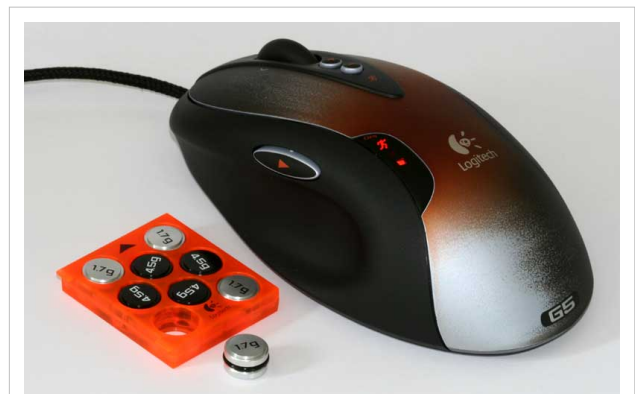
Ratón para videojugadores.