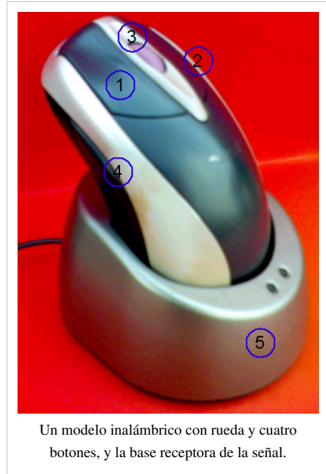
Un modelo inalámbrico con rueda y cuatro botones, y la base receptora de la señal.