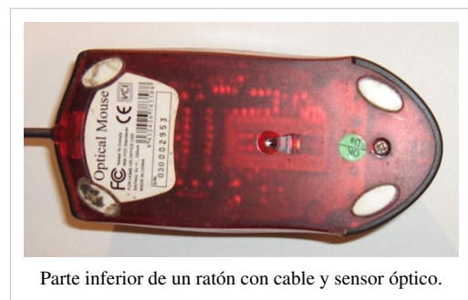
Parte inferior de un ratón con cable y sensor óptico.

Es una variante que carece de la bola de goma que evita el frecuente problema de la acumulación de suciedad en el eje de transmisión, y por sus características ópticas es menos propenso a sufrir un inconveniente similar. Se considera uno de los más modernos y prácticos actualmente. Puede ofrecer un límite de 800 ppp, como cantidad de puntos distintos que puede reconocer en 2,54 centímetros (una pulgada); a menor cifra peor actuará el sensor de movimientos. Su funcionamiento se basa en un sensor