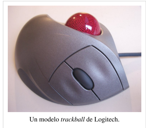
Un modelo trackball de Logitech.

El concepto de trackball es una idea que parte del hecho: se debe mover el puntero, no el dispositivo, por lo que se adapta para presentar una bola, de tal forma que cuando se coloque la mano encima se pueda mover mediante el dedo pulgar, sin necesidad de desplazar nada más ni toda la mano como antes. De esta manera se reduce el esfuerzo y la necesidad de espacio, además de evitarse un posible dolor de antebrazo por el movimiento de éste. A algunas personas, sin embargo, no les termina de resultar realmente cómodo. Este tipo ha sido muy útil por ejemplo en la informatización de la navegación marítima.