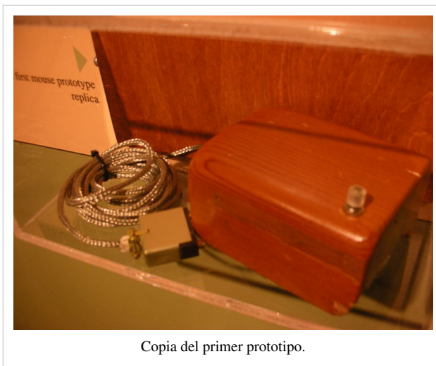
Copia del primer prototipo.

La primera maqueta se construyó de manera artesanal de madera, y se patentó con el nombre de "X-Y Position Indicator for a Display System".