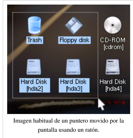
Imagen habitual de un puntero movido por la pantalla usando un ratón.

Con el avance de las nuevas computadoras, el ratón se ha convertido en un dispositivo esencial a la hora de jugar, destacando no solo para seleccionar y accionar objetos en pantalla en juegos estratégicos, sino para cambiar la dirección de la cámara o la dirección de un personaje en juegos de primera o tercera persona. Comúnmente en la mayoría de estos juegos, los botones del ratón se utilizan para accionar las armas u objetos seleccionados y la rueda del ratón sirve para recorrer los objetos o armas de nuestro inventario.