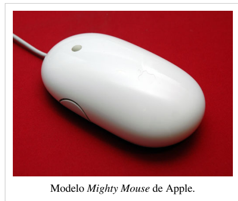
Modelo Mighty Mouse de Apple.

Hasta mediados de 2005, la conocida empresa Apple, para sus sistemas Mac apostaba por un ratón de un sólo botón, pensado para facilitar y simplificar al usuario las distintas tareas posibles. Actualmente ha lanzado un modelo con dos botones simulados virtuales con sensores debajo de la cubierta plástica, dos botones laterales programables, y una bola para mover el puntero, llamado Mighty Mouse.