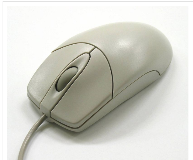
Ratón con cable y rueda.

Hoy en día es un elemento imprescindible en un equipo informático para la mayoría de las personas, y pese a la aparición de otras tecnologías con una función similar, como la pantalla táctil, la práctica ha demostrado que tendrá todavía muchos años de vida útil. No obstante, en el futuro podría ser posible mover el cursor o el puntero con los ojos o basarse en el reconocimiento de voz.