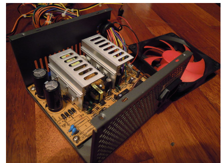
Fuente de alimentación para PC formato ATX (sin cubierta superior, para mostrar su interior y con el ventilador a un lado).

Una fuente conmutada es un dispositivo electrónico que transforma energía eléctrica mediante transistores en conmutación. Mientras que un regulador de tensión utiliza transistores polarizados en su región activa de amplificación, las fuentes conmutadas utilizan los mismos conmutándolos activamente a altas frecuencias (20-100 Kilociclos típicamente) entre corte (abiertos) y saturación (cerrados). La forma de onda cuadrada resultante es aplicada a transformadores con núcleo de ferrita (Los núcleos de hierro no son adecuados para estas altas frecuencias) para obtener uno o varios voltajes de salida de corriente alterna (CA) que luego son rectificadas (Con diodos rápidos) y filtradas (Inductores y capacitores) para obtener los voltajes de salida de corriente continua (CC). Las ventajas de este método incluyen menor tamaño y peso del núcleo, mayor eficiencia y por lo tanto menor calentamiento. Las desventajas comparándolas con fuentes lineales es que son mas complejas y generan ruido eléctrico de alta frecuencia que debe ser cuidadosamente minimizado para no causar interferencias a equipos próximos a estas fuentes.